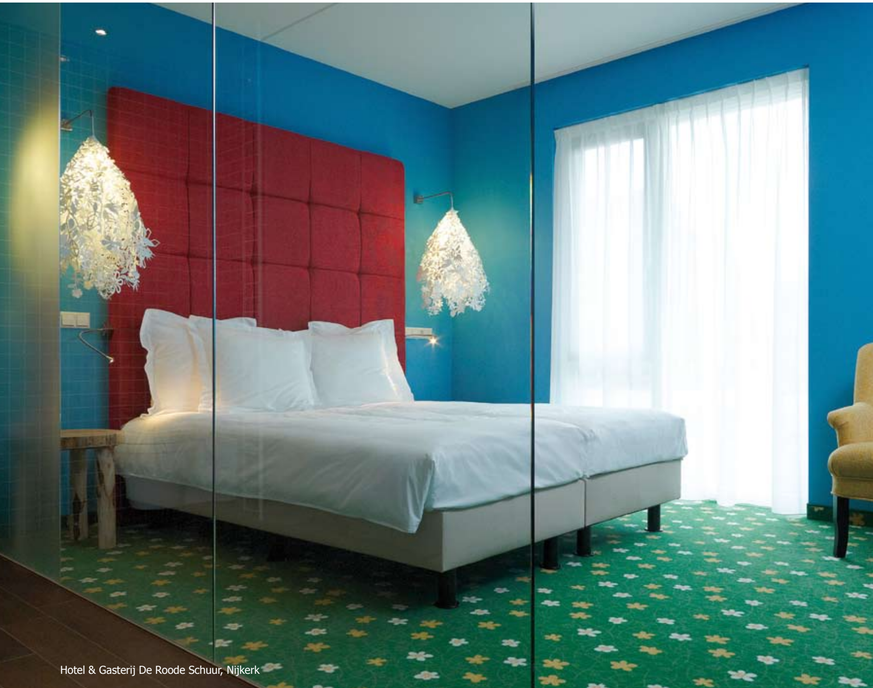
Hotel & Gasterij De Roode Schuur, Nijkerk

Als de uitstraling in overeenstemming is met de corporate identity trekt u zowel klanten als medewerkers aan die bij u passen!